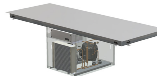
INVISI FREEZE L

GN3/1-Modul Abmessungen: 1020x530x367 mm Max. Leistung: 500 W Spannung: 230 V AC